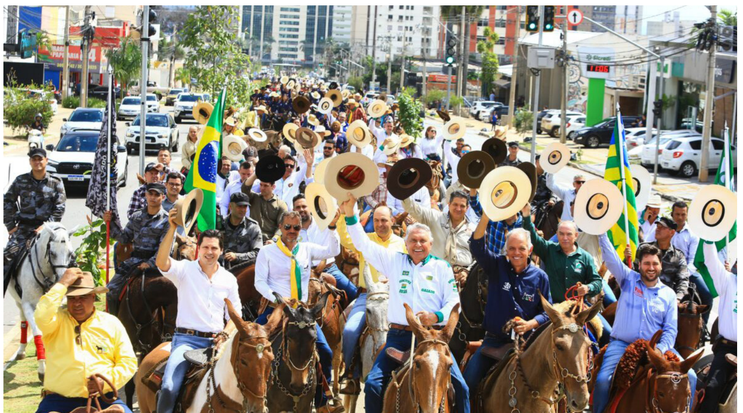
Governador Ronaldo Caiado participa da abertura do 1º Encontro de Comitivas em Goiás e desfile de muladeiros pelas ruas da capital: “Tem muito a ver com a nossa história”