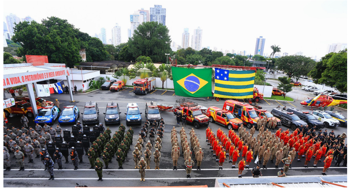
Outro destaque do balanço é que 165 municípios não registraram homicídio de janeiro a março deste ano

No primeiro trimestre de 2024, foram cumpridos 2.258 mandados