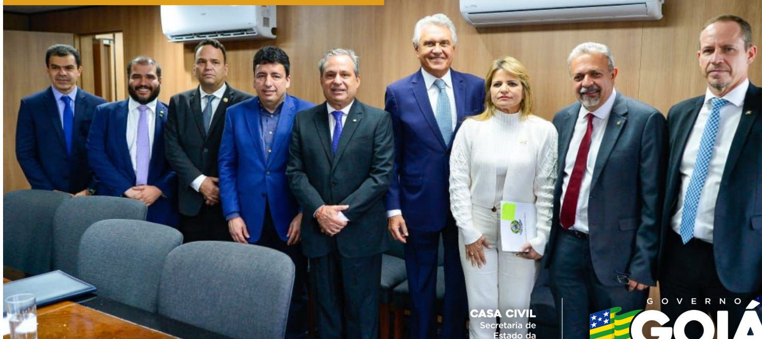
Em reunião com ministro da Justiça, Flávio Dino, governador Ronaldo Caiado leva demandas da área e abre caminho para novas parcerias entre governo federal e estadual

Segurança Pública em Goiás ganha celeridade na utilização de recursos do Fundo Nacional