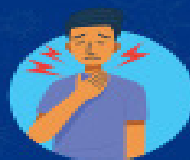
Dificuldade para respirar