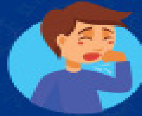
Gotículas de saliva