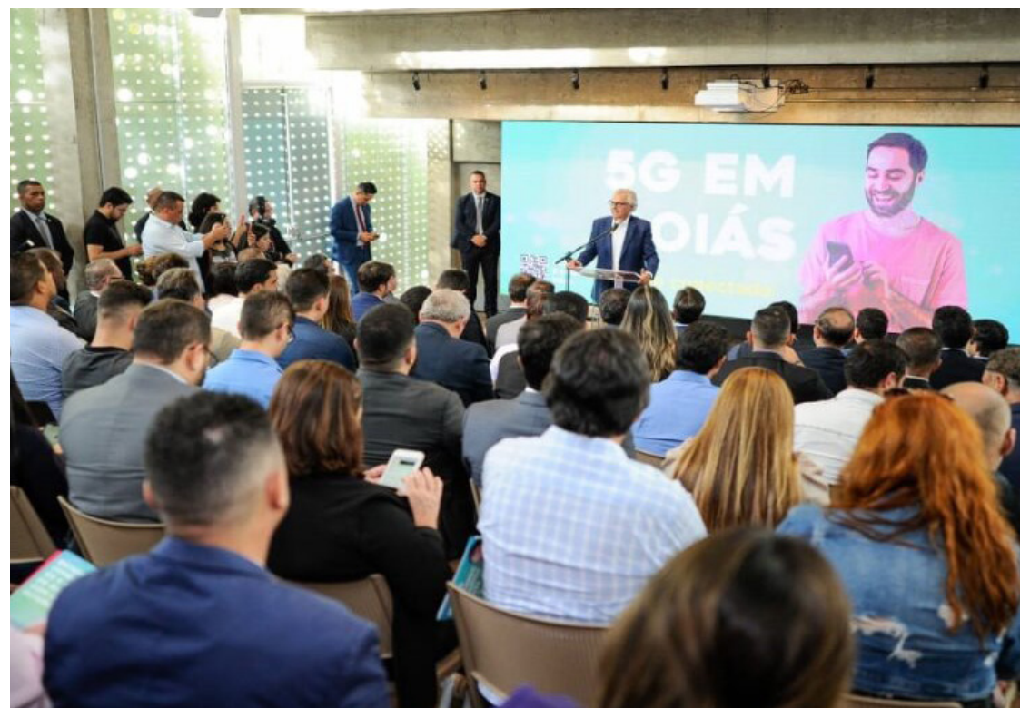
Ronaldo Caiado apresenta legislação do 5G aos municípios: “Temos tudo para gerar a instalação do 5G em primeiro lugar”