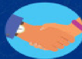
Toque ou aperto de mão